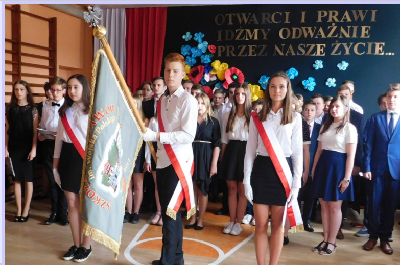
Podczas uroczystości nastąpiło przekazanie sztandaru szkoły uczniom klas VII