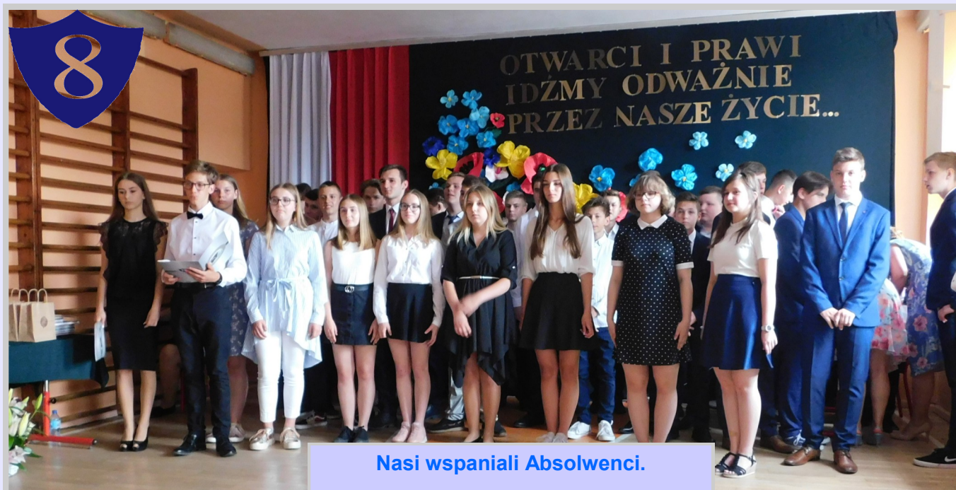
Nasi wspaniali Absolwenci.

Po raz ostatni w tym roku szkolnym dyrekcja, nauczyciele i uczniowie spotykali się w pełnym składzie, aby uroczystie pożegnać ósmoklasistów oraz nagrodzić tych uczniów, którzy zasłużyli na wyróżnienie.